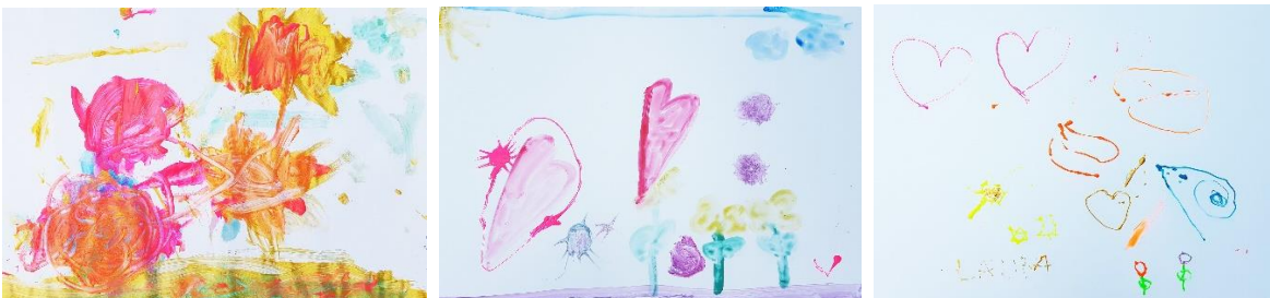
Bilder von der Mal-Aktion zum Weltkindertag 2019.

https://www.nuernberg.de/internet/kinder_und_jugendliche/weltkindertag.html