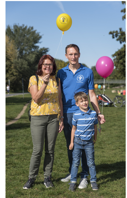
Text und Fotos: Kinderschutzbund Nürnberg

Mehr über uns erfahren Sie unter: www.kinderschutzbund-nuernberg.de oder Sie folgen uns auf Instagram oder Facebook!